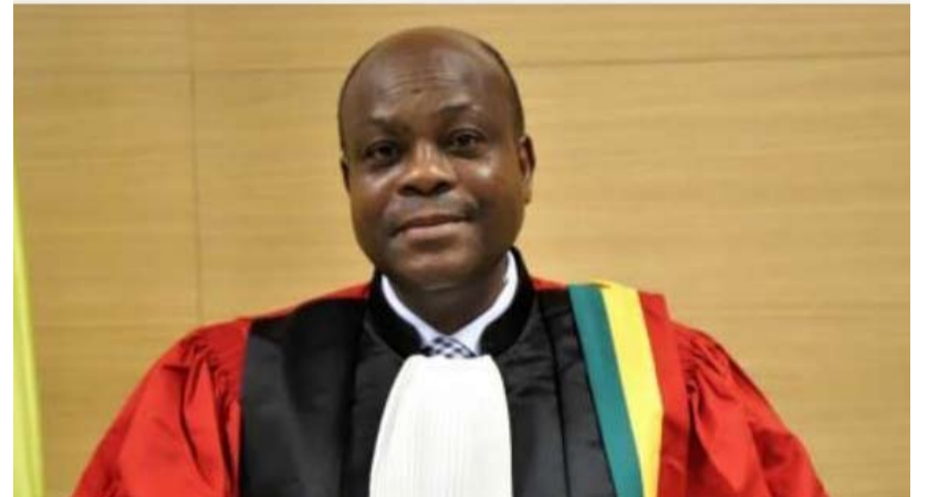
Dorothée Sossa, Président de la Cour Constitutionnelle

Troisièmement, à la date de dépôt des candidatures à l'élection présidentielle le 5